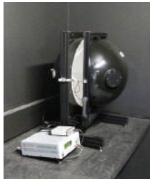
Ulbrichtkugel Vermessung LED