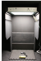
Transmissions- messung Abdeckung