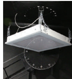
Gonio-Photometer Vermessung Leuchte