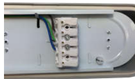
5 pol. Anschlusskl.